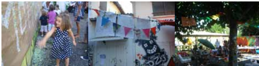
Souvenirs de l'édition zéro, Moï Moï Gaua le 21 août 2009 _

intéressement des pieds | et | déchaînement de l'esprit